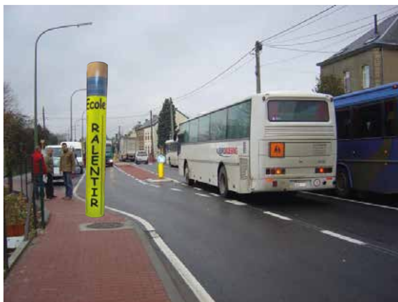
Crayon 3D - Ref : 13001002

Notre crayon 3D fluo est conçu pour une visibilité à 360° et une efficacité accrue.